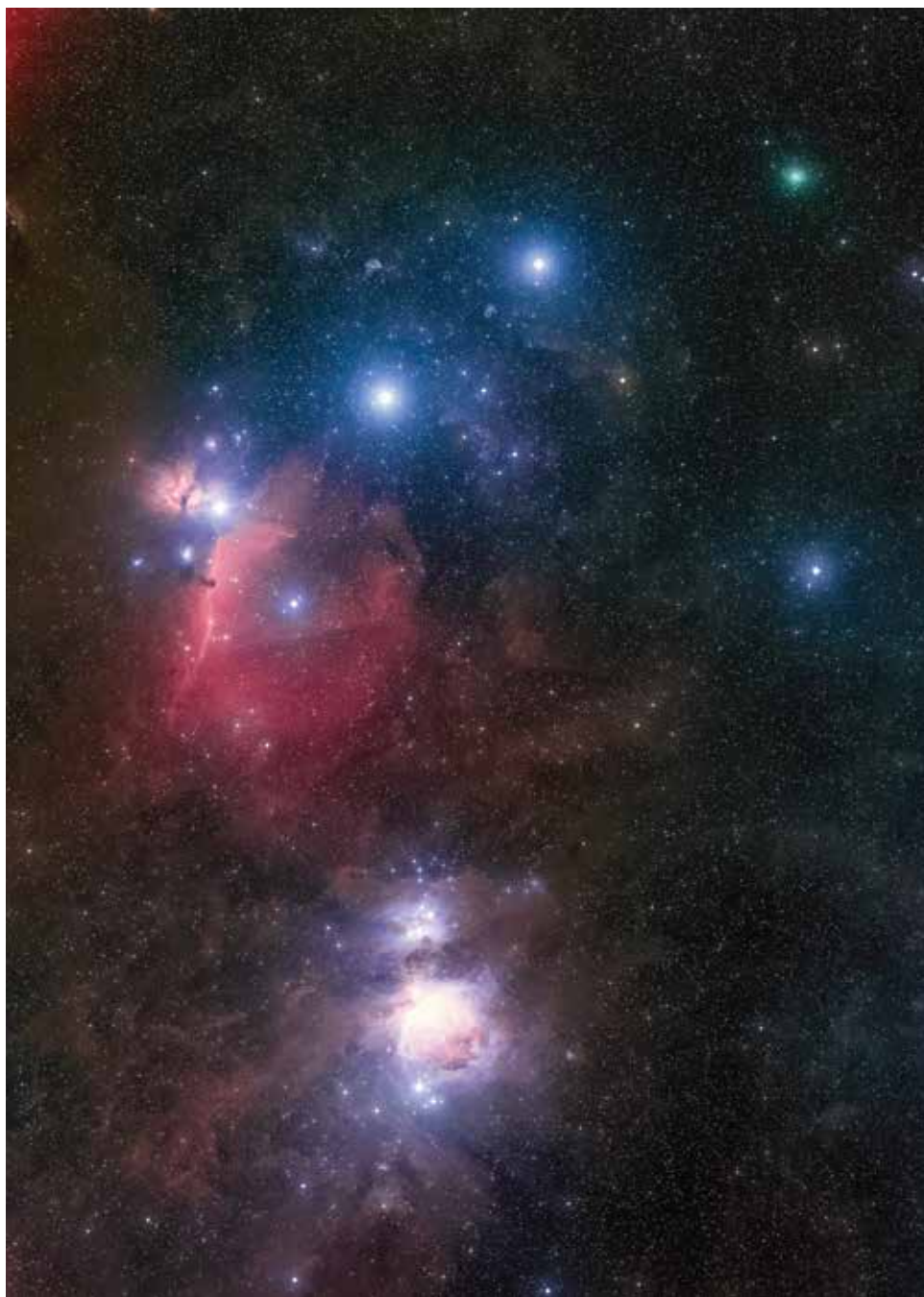
A C/2020 M3 (ATLAS)-üstökös az Orionban