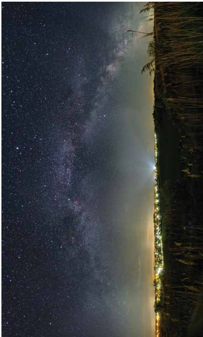
Csillaghíd Tápióbricske felett