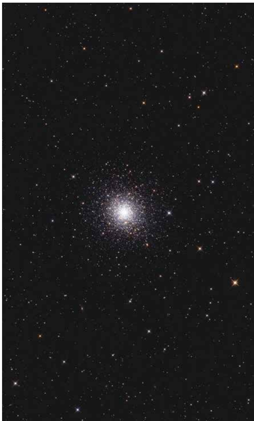
Messier 92 gömbhalma