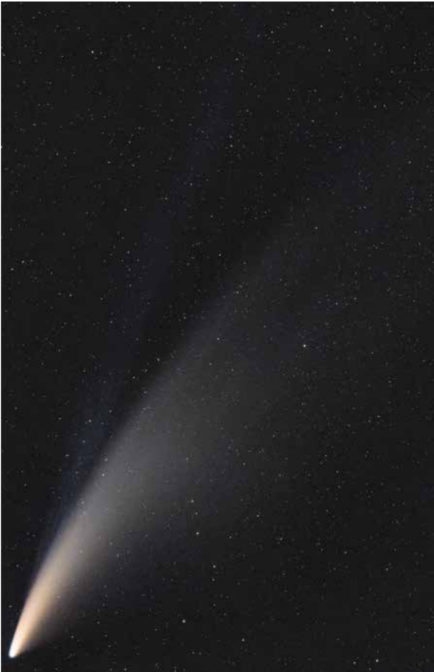
C/2020 F3 (NEOWISE)-üstökös