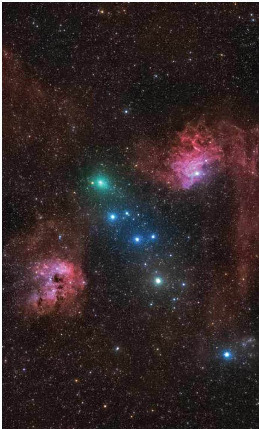
A C/2020 M3 (ATLAS)-üstökös és az Auriga köösségei